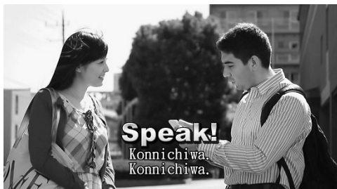
図3 <Can-do Practice>の例

ここでは、スキットから切り出した画像(静止画)と音声を組み合わせて使用している。学習者は画像を見て、状況や場面をイメージしながら音声を聞き、「Your turn!」の文字が出たら、画面に向かって話してみる。自分一人で答えられたら、Can-doが達成できたことになる。