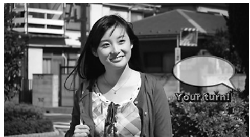
図4 <Can-do Challenge>の例